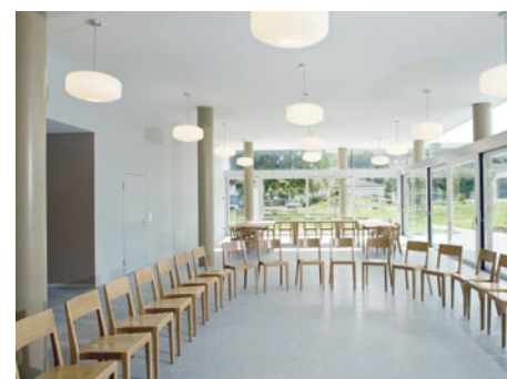
Im Erdgeschoss findet sich ein grosser, heller Gemeinschaftsraum, den auch Externe mieten können.

suchten wir eine Lösung, die den Baukörper mit seinen fünf Wohnungen pro Stockwerk schlanker macht. Wichtig war uns, dass die Fassaden die Umgebung aufnehmen. Die lasierten Plättli bieten eine gewisse Spiegelung und wechseln auch den Farbton je nach Witterung. Bei den «wild» angeordneten Fenstern ging es uns darum, die Einförmigkeit des Hochhauses aufzubrechen und den Wohnungen trotz gleicher Grundrisse eine gewisse Individualität zu verleihen.