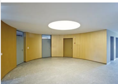
Die Wohnungszugänge sind besonders grosszügig gestaltet worden; Oblichter bei den Wohnungstüren zeigen, ob jemand zu Hause ist.