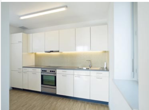
Küchen und Bäder sind zweckmässig und hindernisfrei gestaltet.

Die blauen Keramikplatten stellen zum einen eine Reverenz an die 1960er-Jahre dar, als diese Verkleidung besonders in Deutschland oder in Italien häufig war. Gleichzeitig